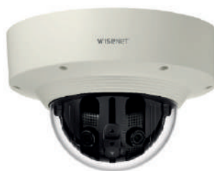
Caméras : HANWHA Caméras panoramiques 180°