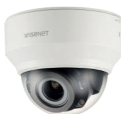
Caméras : HANWHA dôme intérieur