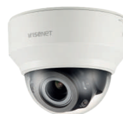
Caméras : HANWHA dôme extérieur