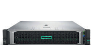
Serveurs pour la gestion du logiciel de marque HP