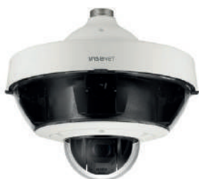
Caméras : HANWHA Caméras PTZ multi-objectifs