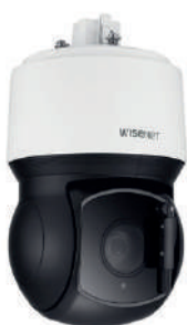
Caméras : HANWHA dôme PTZ IP 4K