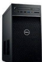
Postes clients et poste du mur d'image de marque DELL